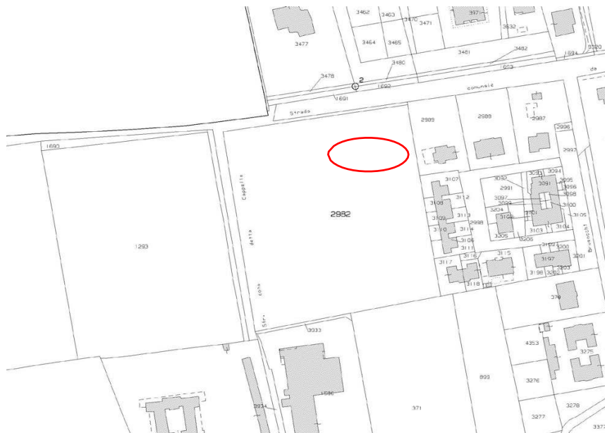
Figura 1 Estratto di Mappa Catastale

Il lotto risulta pianeggiante e di forma regolare ed ospiterà l'itero Polo dell'Infanzia di Fornovo San Giovanni comprensivo di: asilo nido, scuola dell'infanzia, scuola media e laghetto dell'invarianza idraulica.