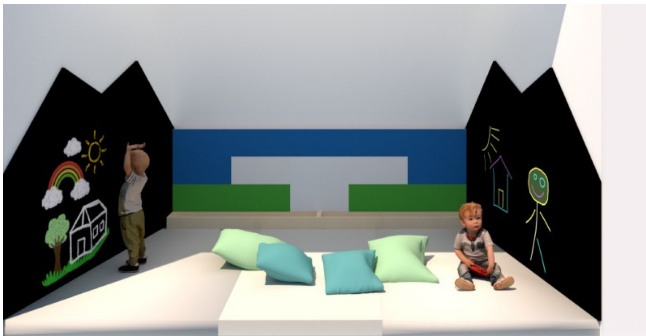
Figura 4 progetto dell'aula morbida con pareti-gioco

Per completare gli spazi scolastici sono stati inseriti locali per lo staff dell'asilo tra cui il bagno, lo spogliatoio, il locale per lo sporzionamento delle pappe e infine il locale tecnico.