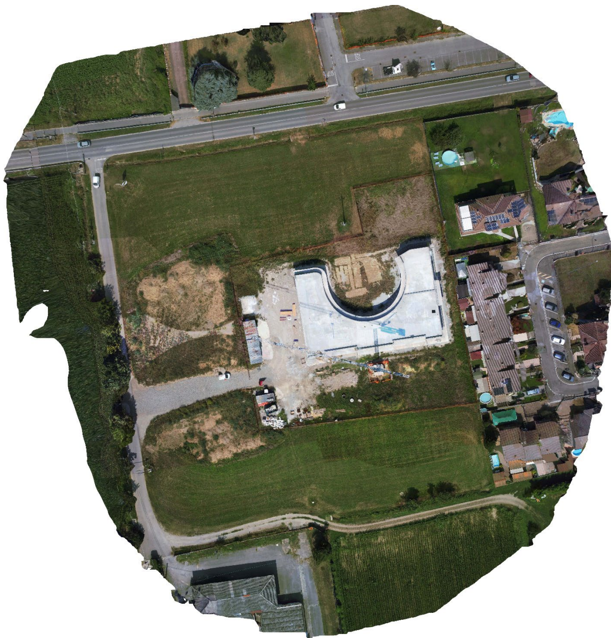
Figura 2 Ortofoto georeferenziata

Negli elaborati del C.S.P. viene descritta nel dettaglio la gestione contemporanea di questi 3 cantieri.