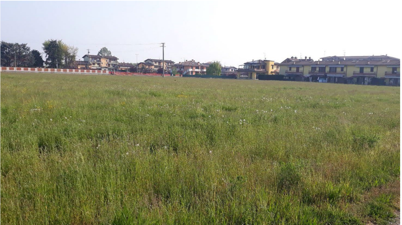
Figura 1: Vista in direzione Nord verso la via Caravaggio (si notano in lato est villette esistenti)