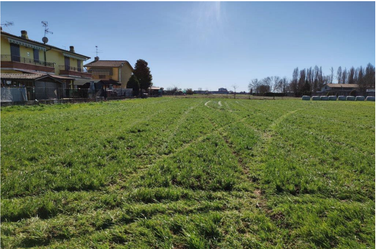
Figura 4: vista dell'area di intervento