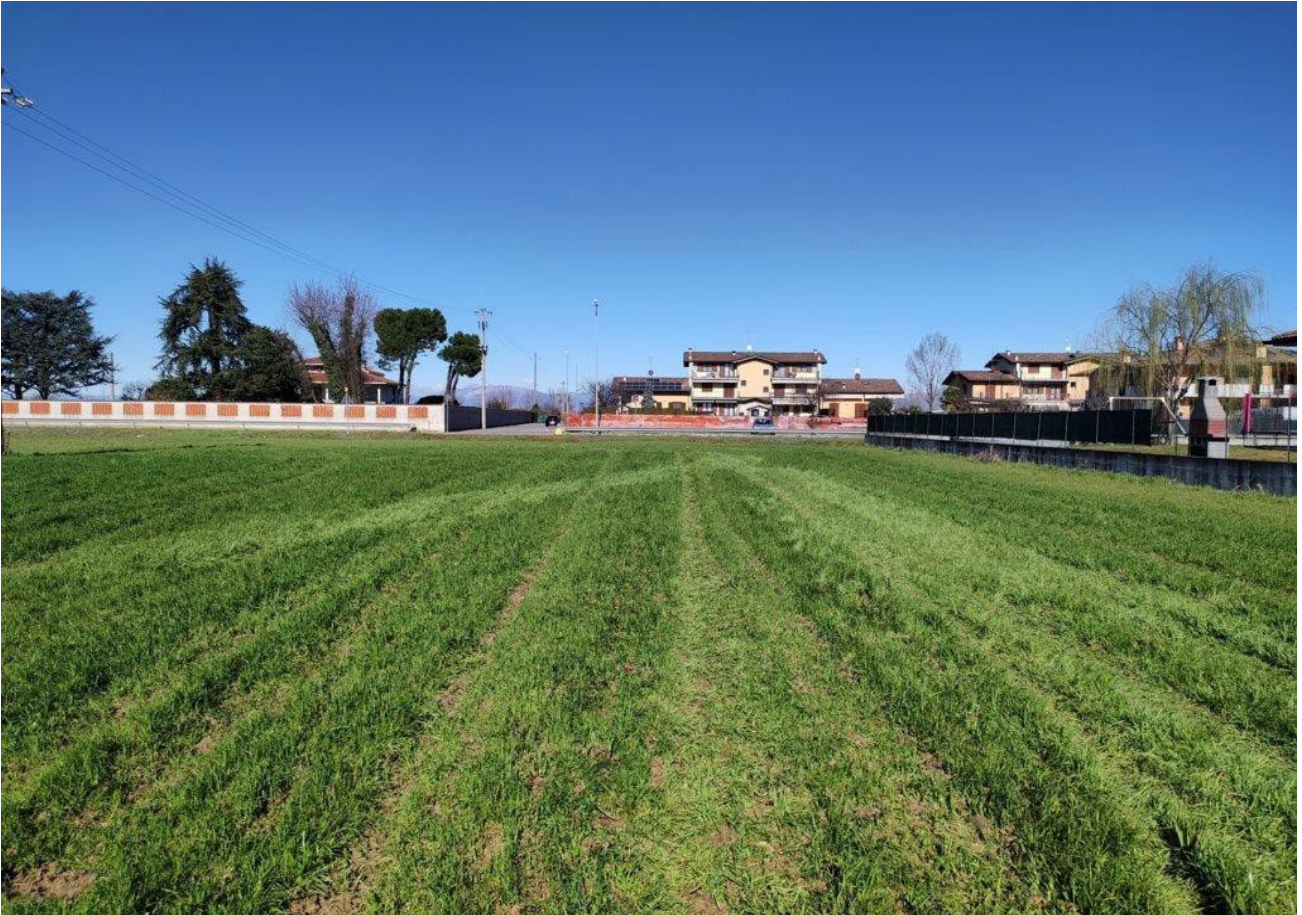
Figura 6: vista complessiva dell'area di intervento