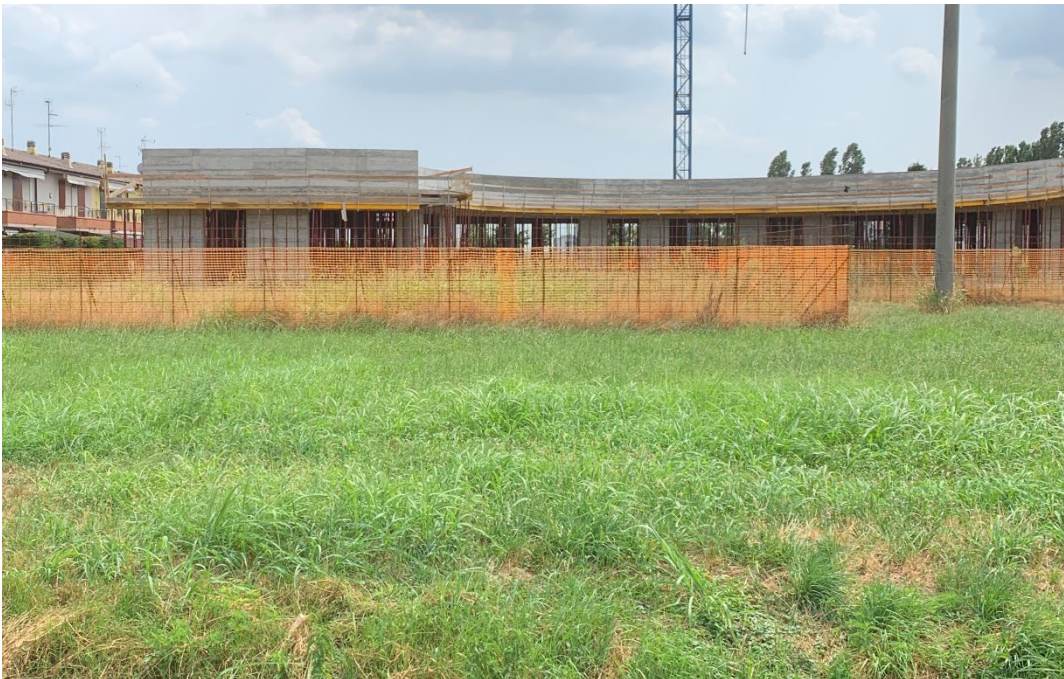
Figura 8: l'area in cui sorgerà l'asilo nido