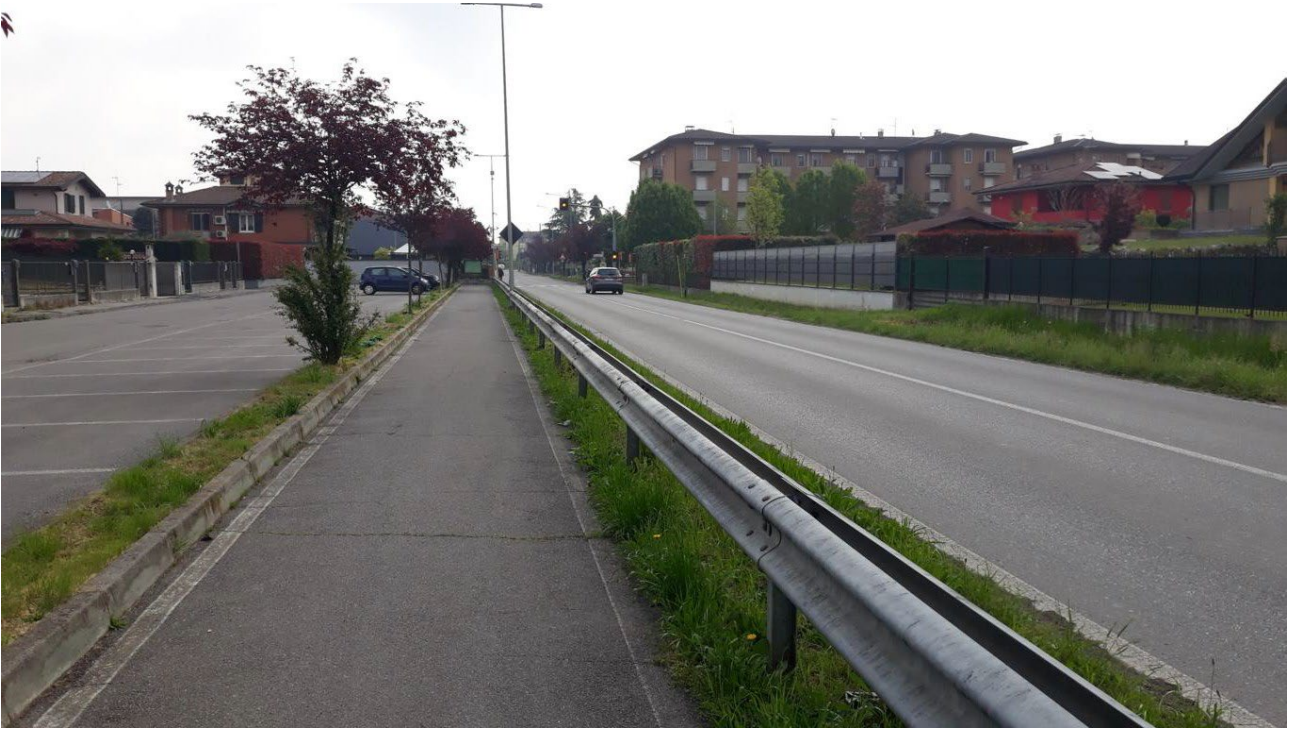
Figura 3: Vista da via Caravaggio verso il Centro del Paese