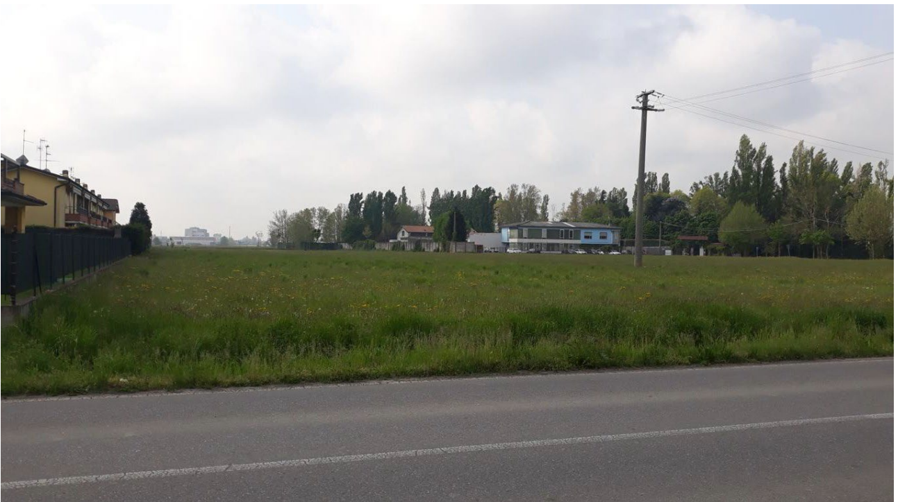
Figura 2: Vista in direzione Sud (si nota in fondo l'edificio industriale / artigianale esistente)